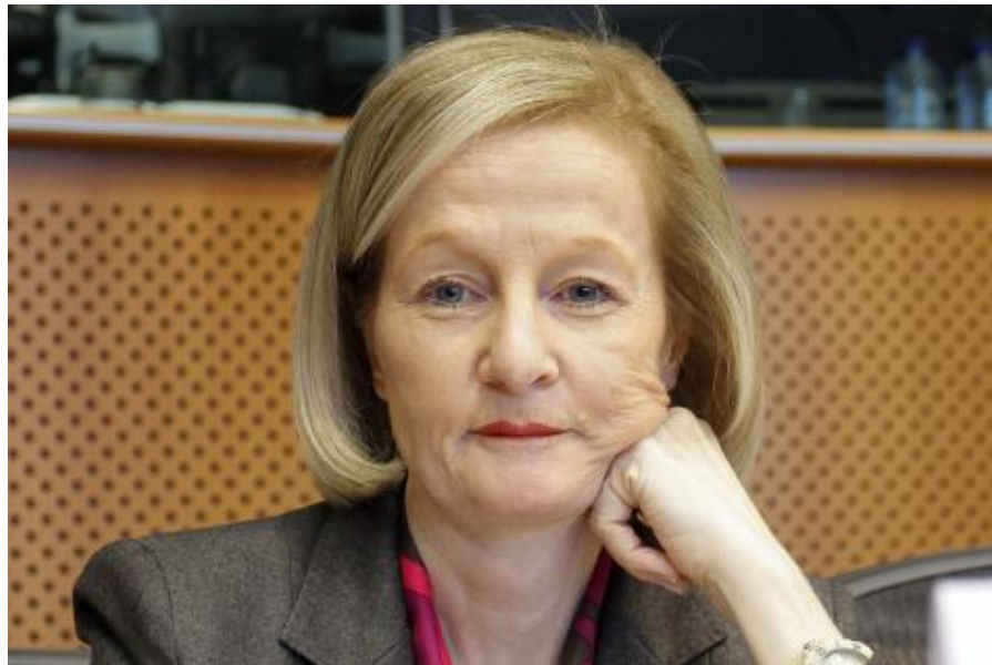
Danièle Nouy, présidente du Conseil de Supervision de la Banque central européenne